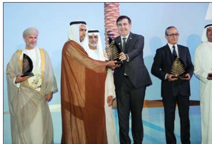
•• ابوظبي - الفجر

أعلن معالي الشيخ نهيان مبارك آل نهيان وزير التعليم العالي والبحث العلمي، رئيس مجلس أمناء جائزة خليفة الدولية لنخيل التمر، إنشاء مركز خليفة للتقانات الحيوية والهندسة الوراثية، تحت مظلة جامعة الإمارات العربية المتحدة، كونها النوع الحاضر للمعرفة والمنتج لثقل العلوم وتقنية راسخة، وتشجيع الشيخ خليفة بن زايد آل نهيان رئيس الدولة حفظه الله في دعمه اللامحدود للبحث العلمي عبر مؤسساته المتخصصة، بهدف تنمية قطاع زراعة النخيل على أرضية علمية وتقنية راسخة، وتشجيع الاستثمار في صناعة التمر كونه أحد ركائز اقتصادنا الوطني بالإمارات. خلال حفل تكريم الفائزين بجائزة خليفة الدولية لنخيل التمر في دورتها الخامسة صباح أمس الأحد في الثالث من شهر مارس 2013 بقصر الإمارات في العاصمة أبوظبي. بحضور عدد من أصحاب المعالي وزعماء الزراعة العرب وأصحاب السعادة والسفراء المعتمدين لدى الدولة، إضافة إلى رؤساء المنظمات الإقليمية والدولية وعدد كبير من الباحثين والمهتمين بشجرة نخيل التمر وأعضاء اللجنة العلمية والفائزين والمكرمين بالجائزة بدورتها الخامسة 2013.