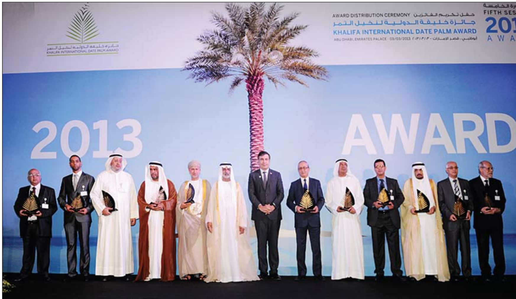
نهيان مبارك يكرم الفائزين بجائزة خليفة الدولية لنخيل التمر في دورتها الخامسة